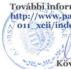
Kövér László az Országgyűlés elnöke

További információ a programról: http://www.parlament.hu/aktual/2011_xcii/index1/bundestag_info